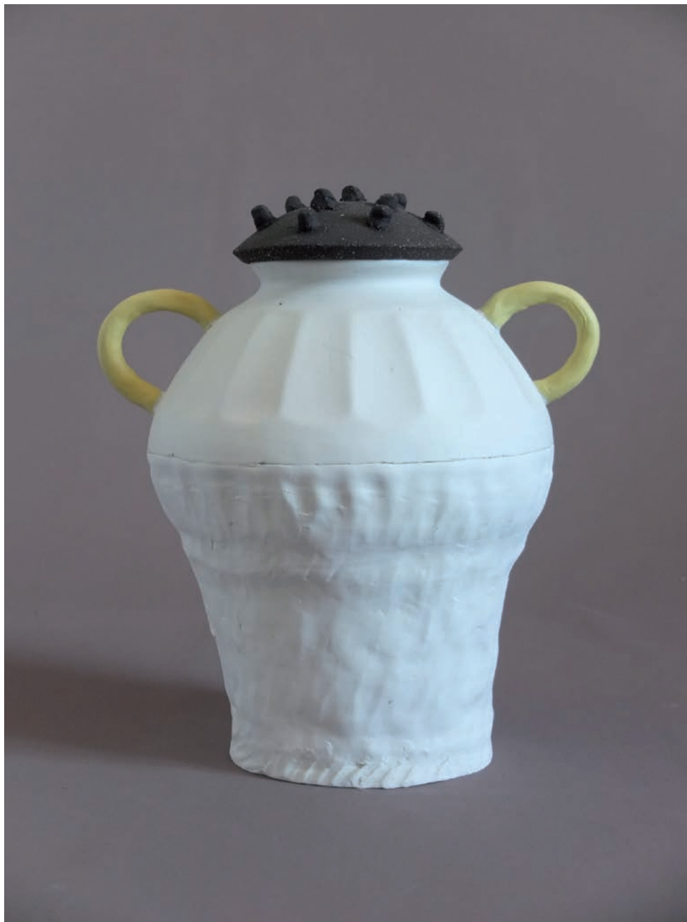
Grenier (série), techniques : colombin, modelage. Matières : porcelaine, porcelaine teinté, grès, décor. Surface : terre brute, émail. Cuisson : 1280° / four à gaz, 2017.