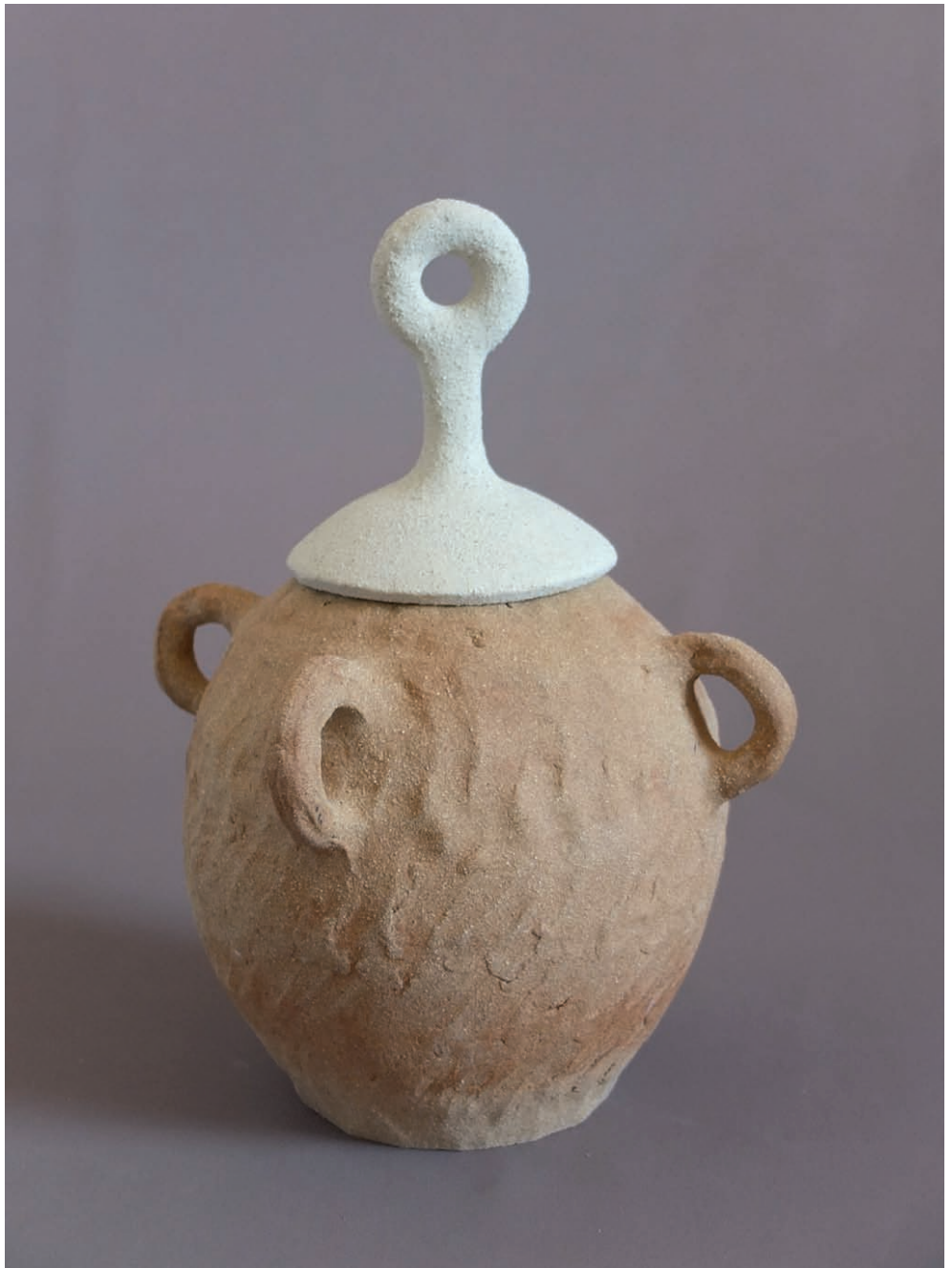
Grenier (série), techniques : colombin, modelage. Matières : grès, décor. Surface : terre brute, émail. Cuisson : 1280° / four à gaz, 2017.