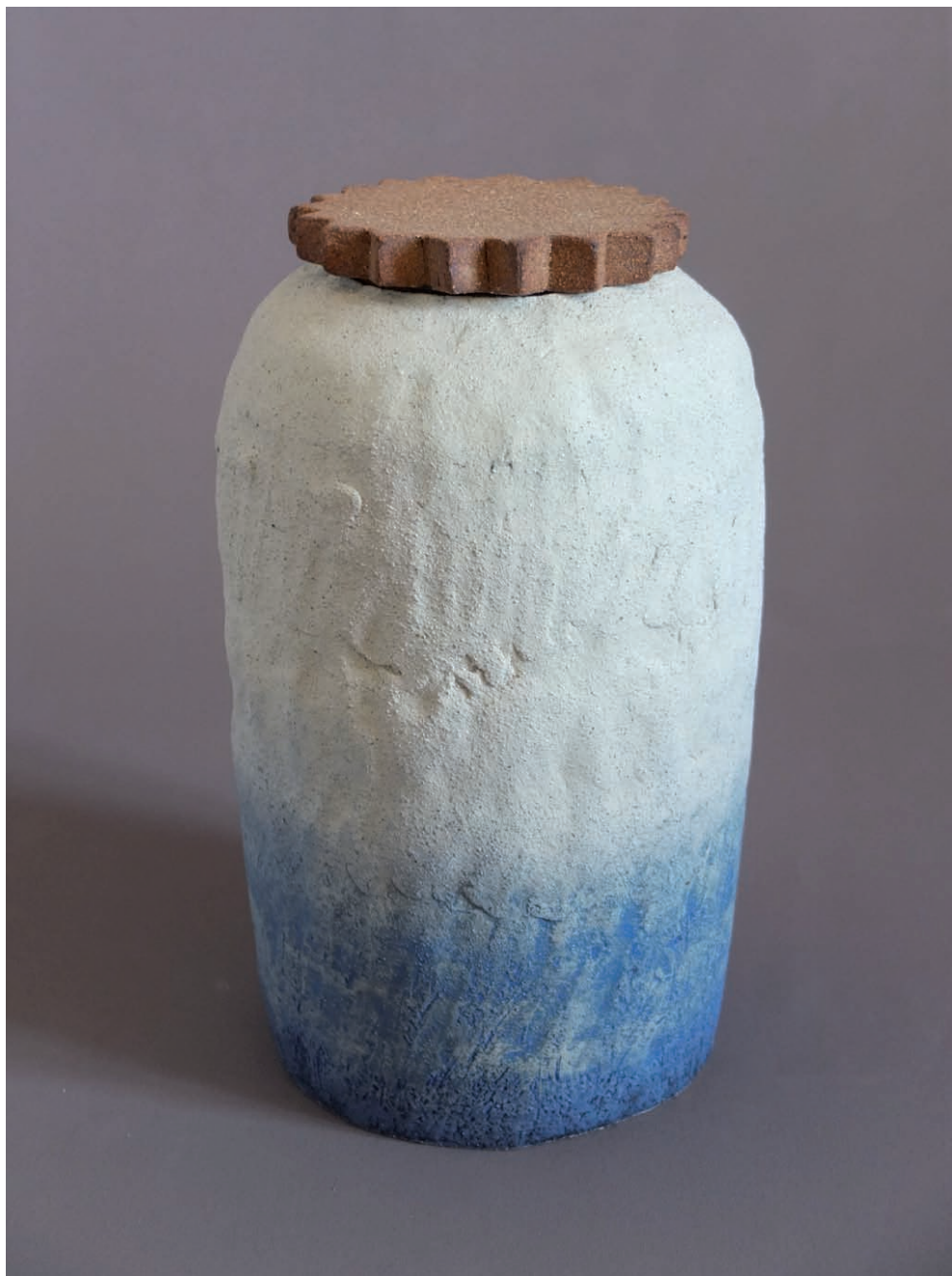
Grenier (série), techniques : colombin, modelage. Matières : grès, décor. Surface : terre brute, émail. Cuisson : 1280° / four à gaz, 2017.