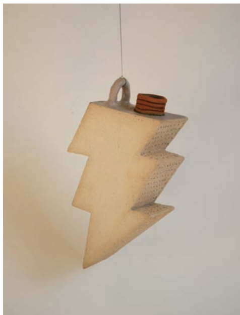
Fétich (série) , techniques : colombin, estampage, plaque, modelage. Matières : grès, porcelaine, porcelaines teintées. Surface : terre brute, émail, décors. Cuisson : 1280° / four à gaz, 2015, 2016, 2017.