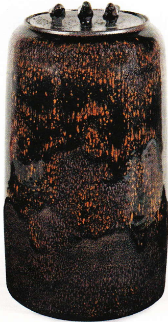
4 505 € frais compris. Jean Girel, boîte en porcelaine recouverte d'un émail en gouttes ocre, h. 30, l. 16 cm. Paris, Espace Rossini, 22 novembre 2011. Rossini SVV.