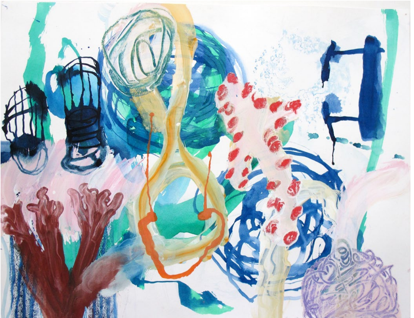
Lost and Found, 2017 Dessin, techniques mixtes 50 x 65 cm