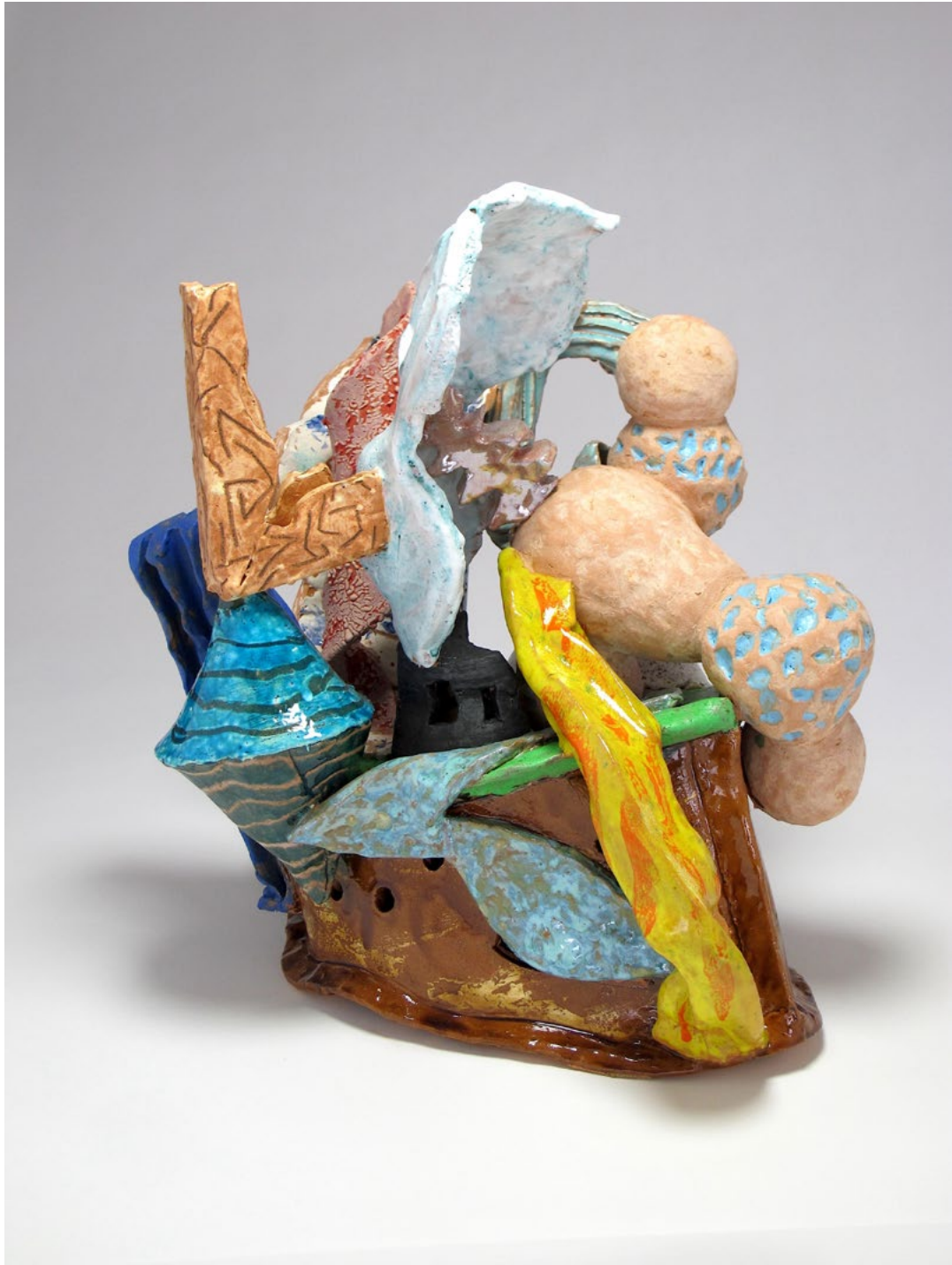
Along Came Betty, 2024 Terre cuite émaillée 48 x 44 x 39 cm